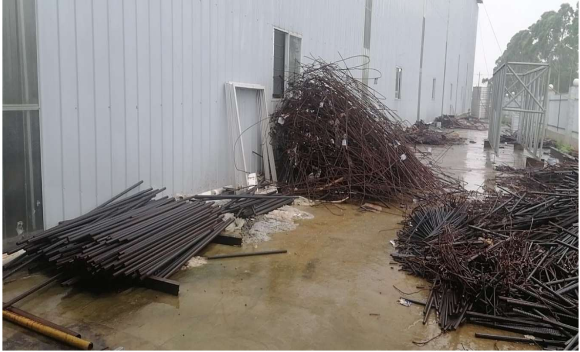
3#小型构件厂废钢材、存放地点：柳江区（图3）