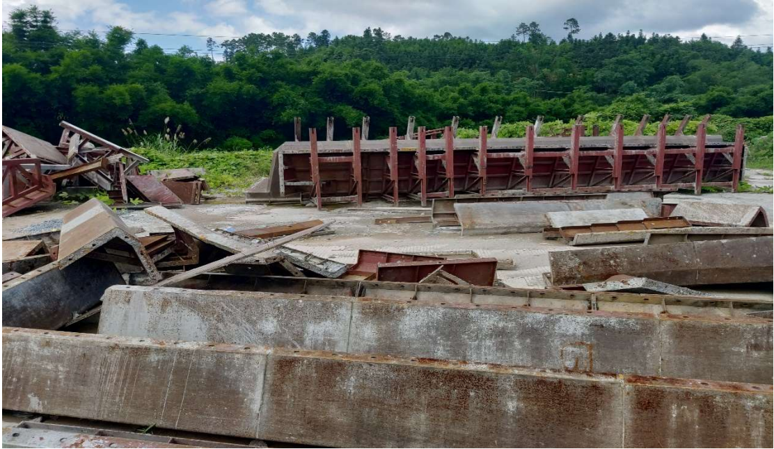
4#废旧材料 T 梁模板、存放地点：苍梧县（图片 1）