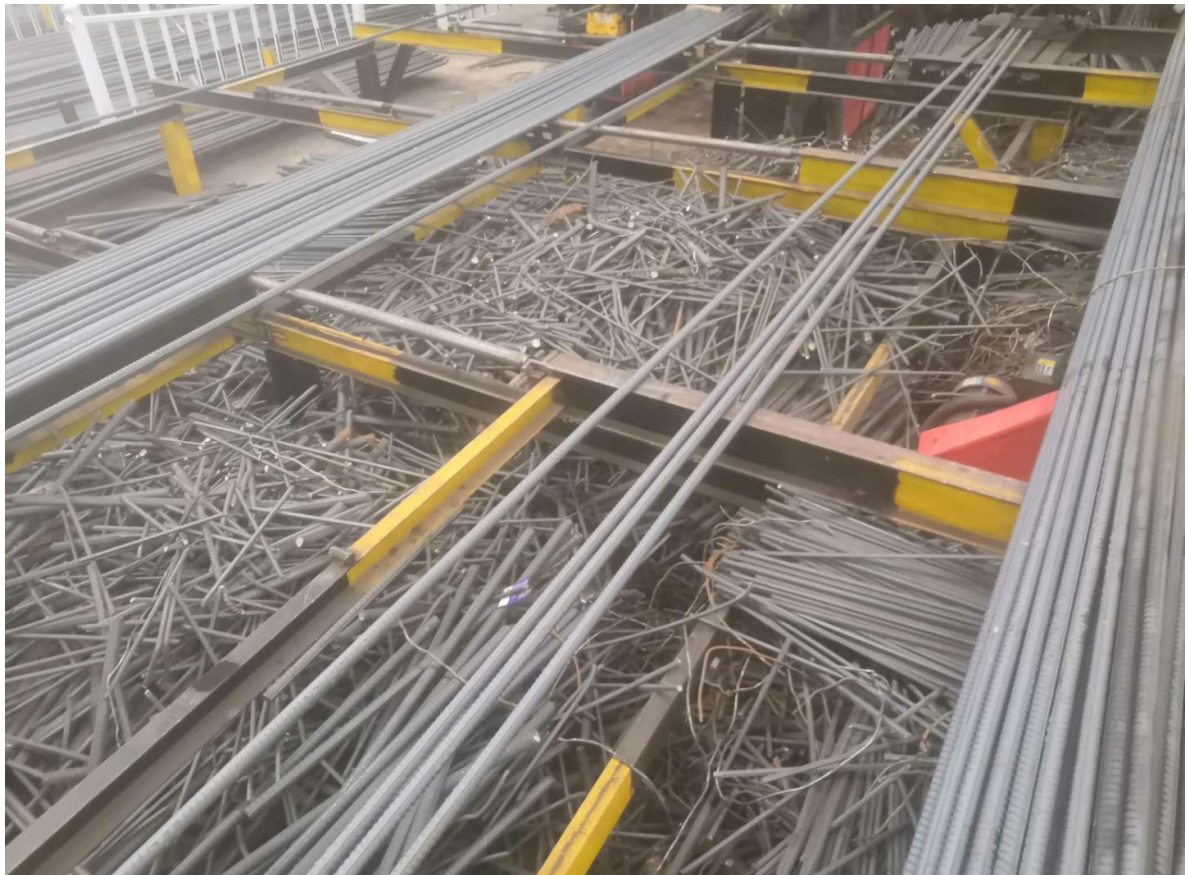
3#钢筋加工场废钢材、存放地点：柳江区（图6）