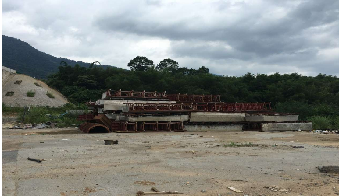
1#钢模板不锈钢 T 梁模板、存放地点：昭平县（图 1）