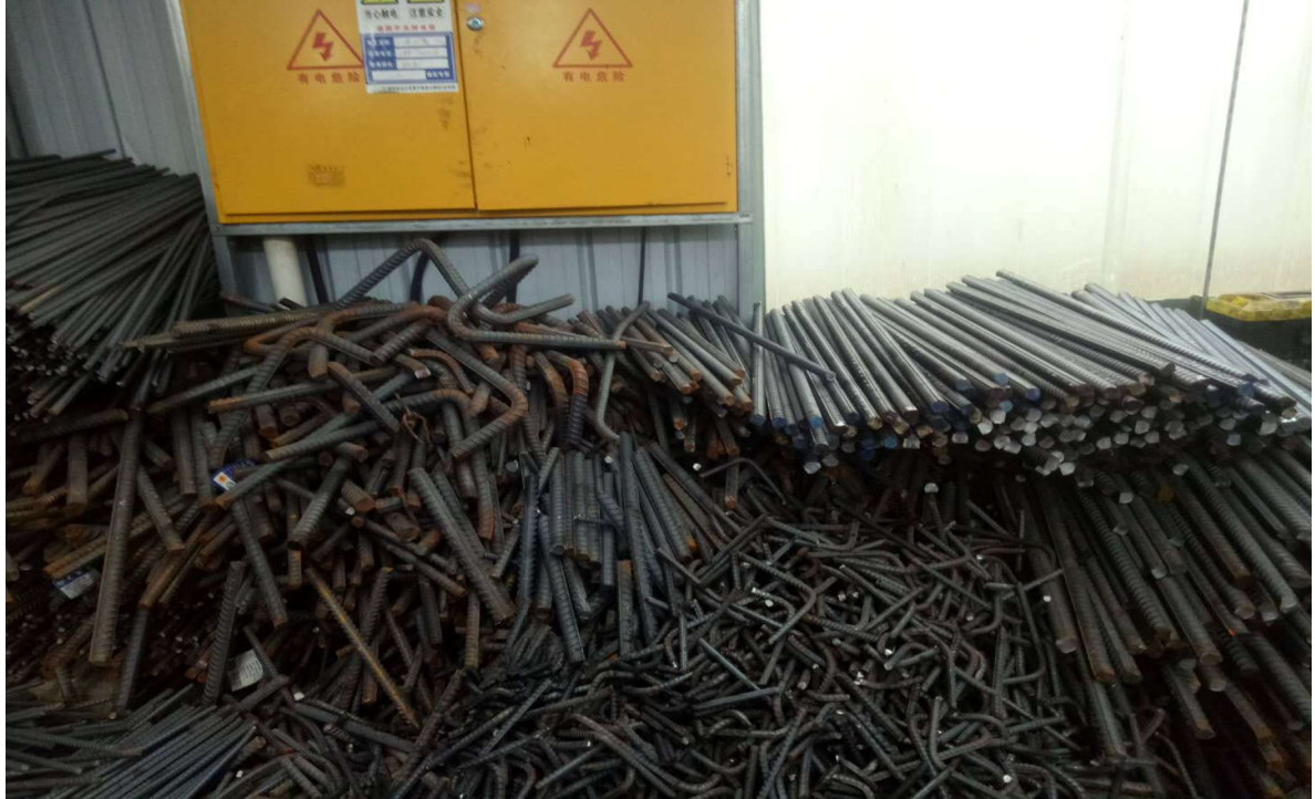
3#钢筋加工场废钢材、存放地点：柳江区（图1）