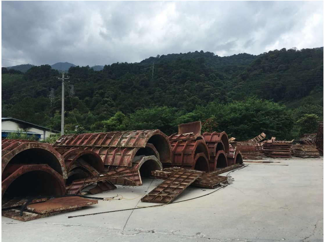
1 #钢模板圆柱模、存放地点：昭平县（图 3）