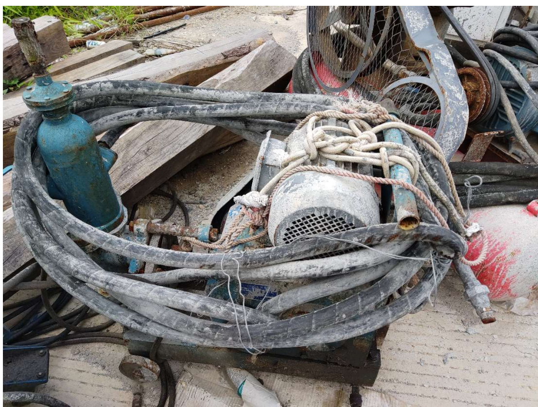
4#废旧材料压浆机、存放地点：苍梧县（图片 4）