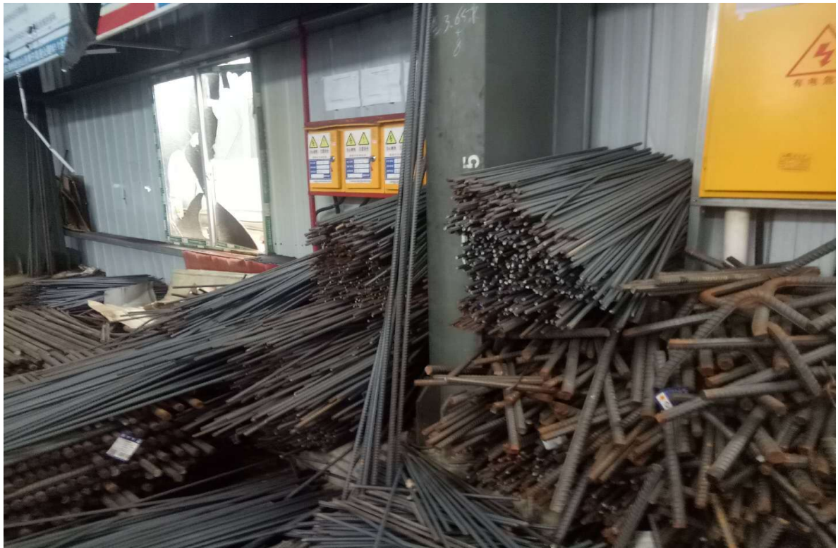
3#钢筋加工场废钢材、存放地点：柳江区（图2）