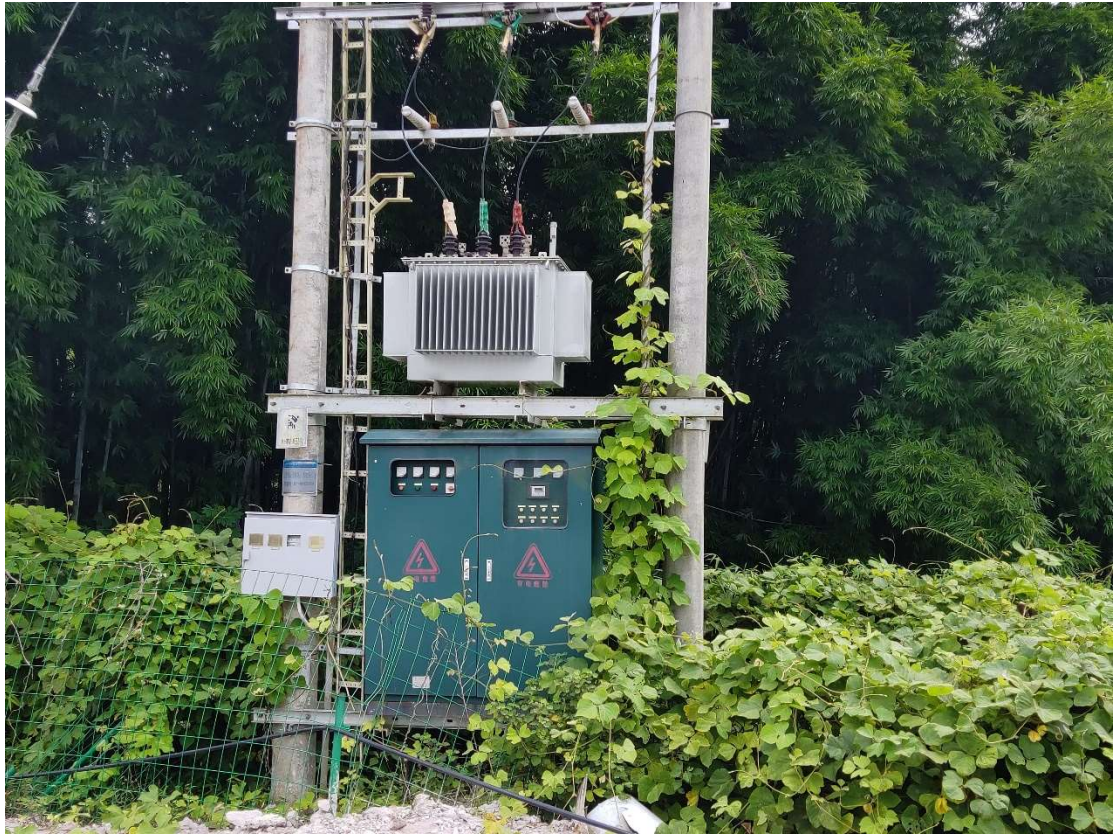
4#废旧材料变压器、存放地点：苍梧县（图片 5）