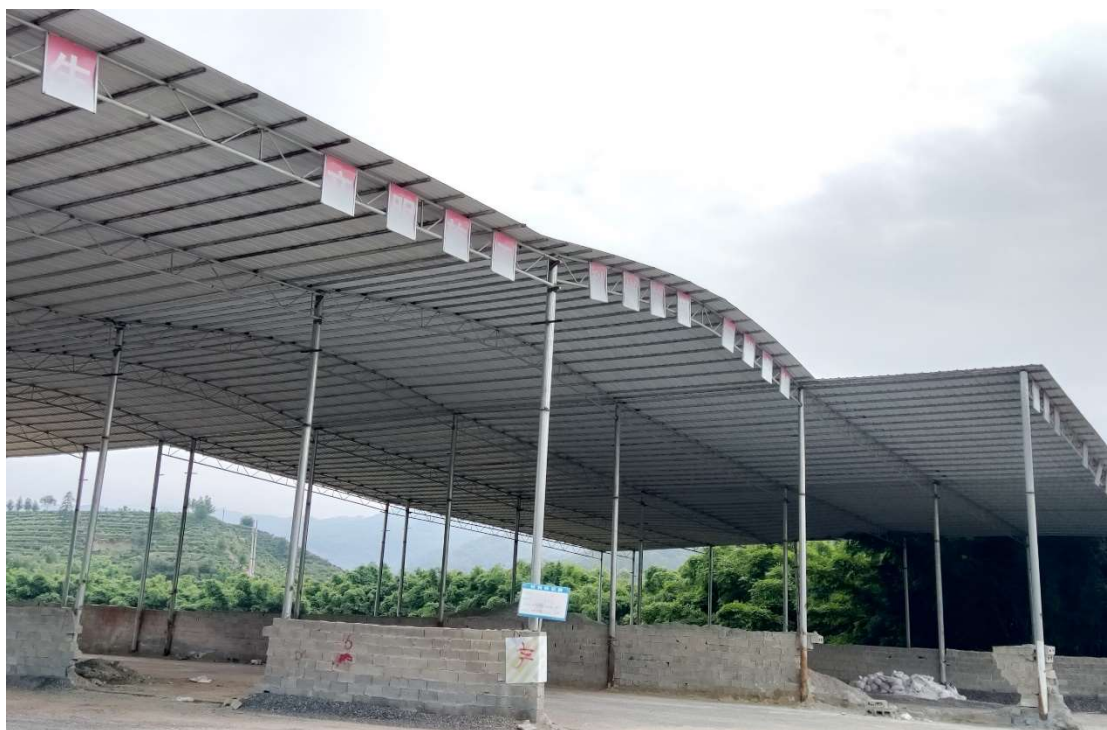
5#料棚、存放地点：苍梧县（图片2）