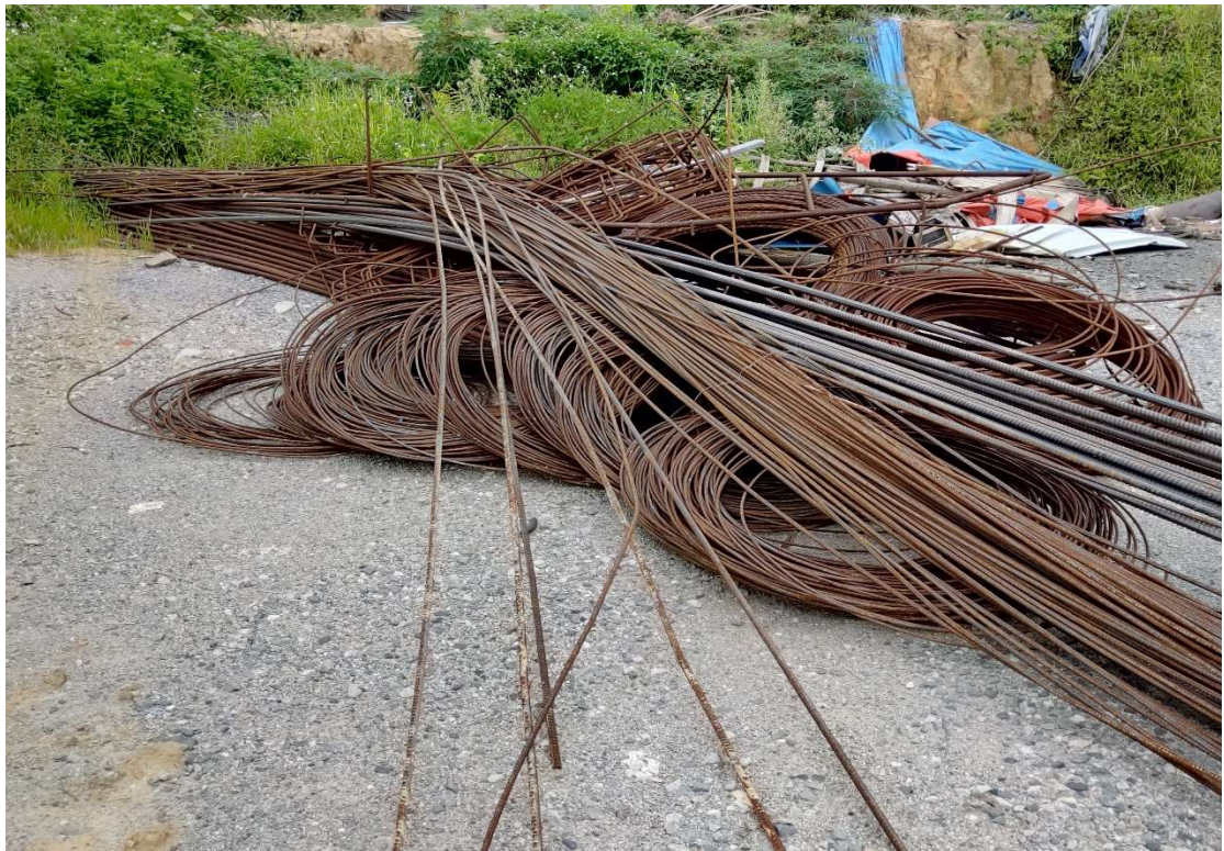
4#废旧材料钢筋、存放地点：苍梧县（图片 6）