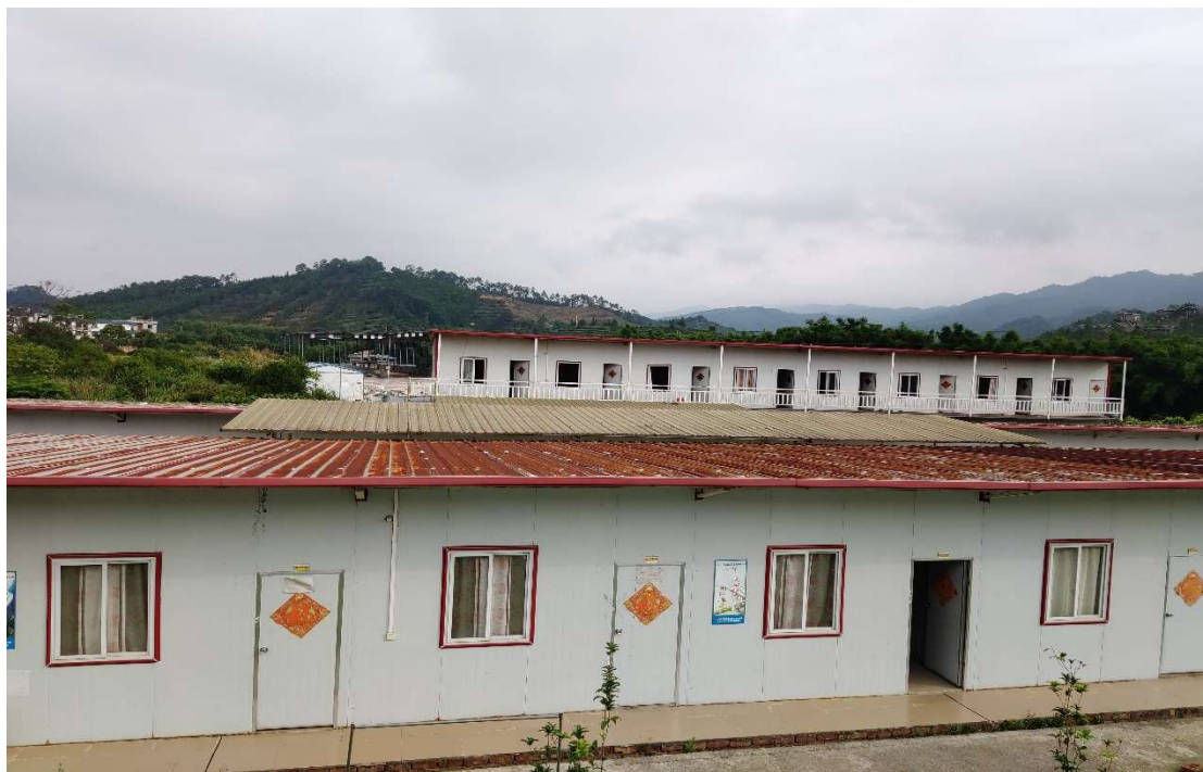
5#板房、存放地点：苍梧县（图片1）