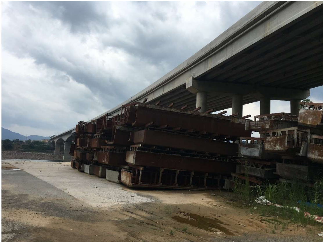
1#钢模板普通 T 梁模板、存放地点：昭平县（图 2）