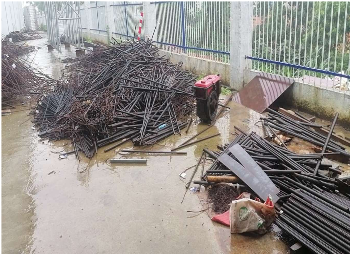
3#小型构件厂废钢材、存放地点：柳江区（图4）