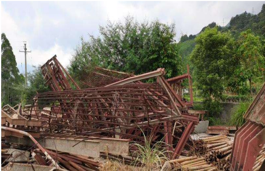
2 #废旧钢筋、存放地点：昭平县（图 1）