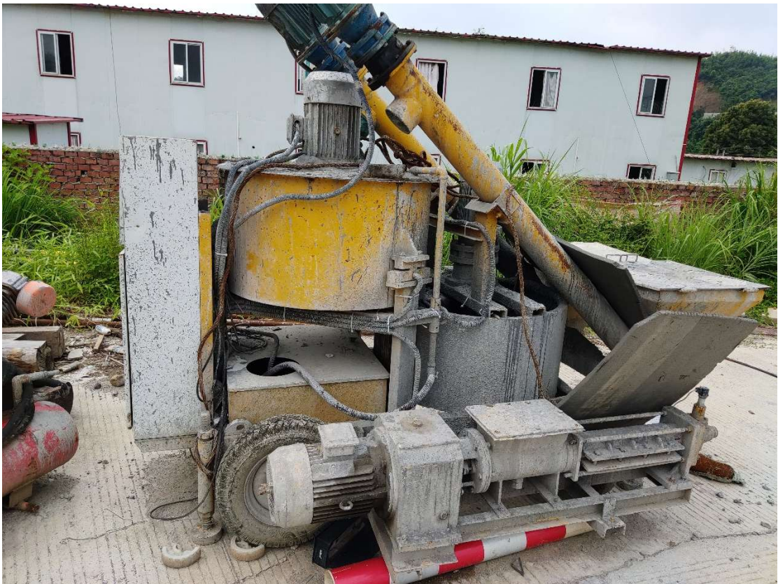
4#废旧材料压浆机、存放地点：苍梧县（图片 2）