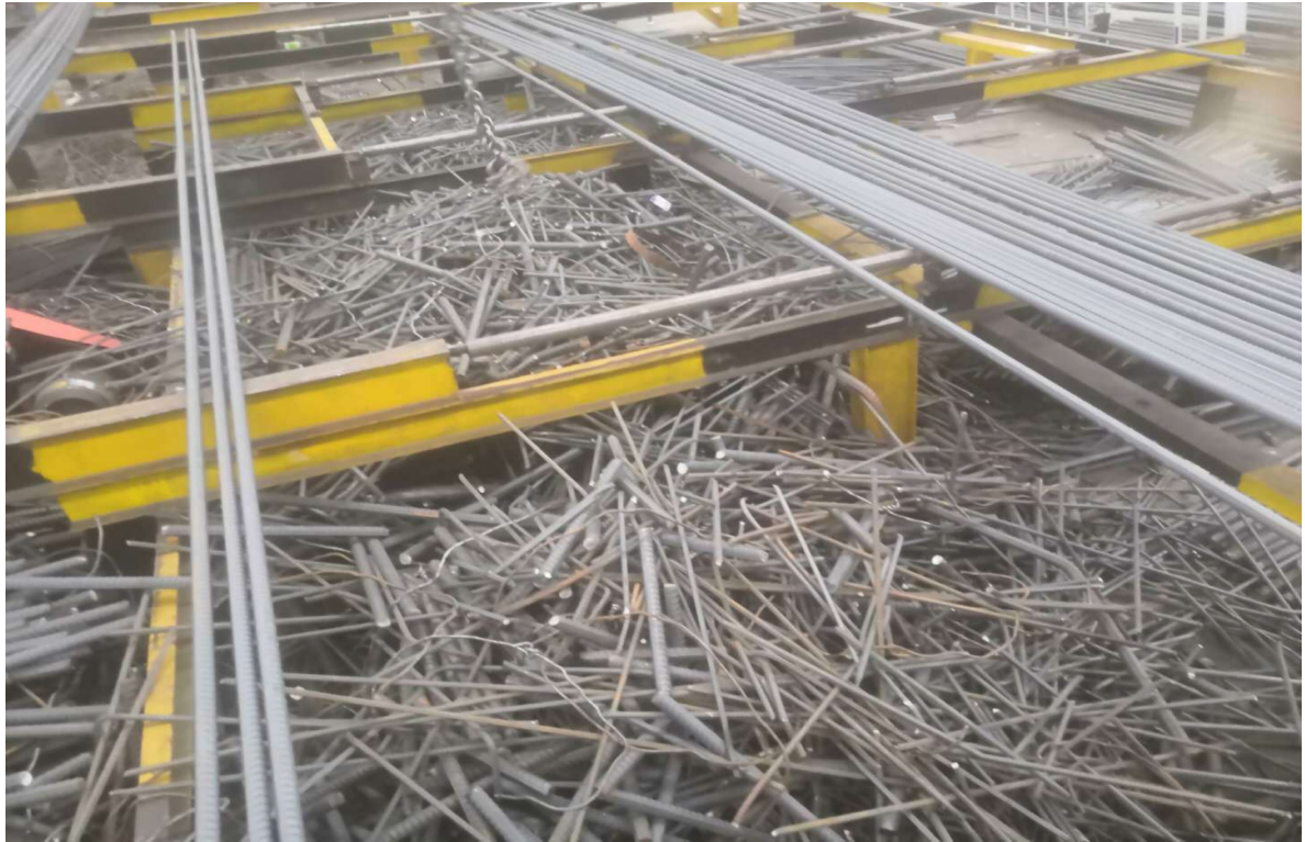
3#钢筋加工场废钢材、存放地点：柳江区（图5）