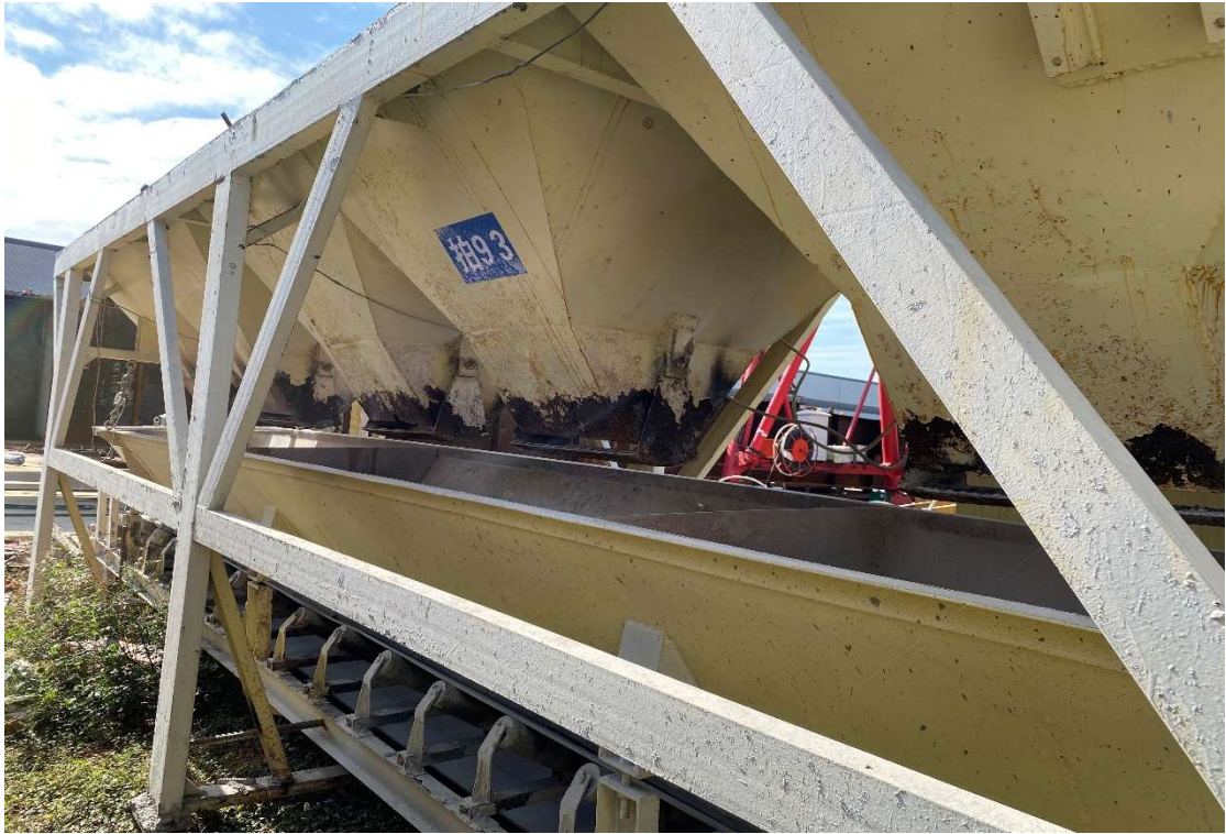
拍卖标的号为：12#（图片：拍 93#） 存放地点：扶绥县山圩基地