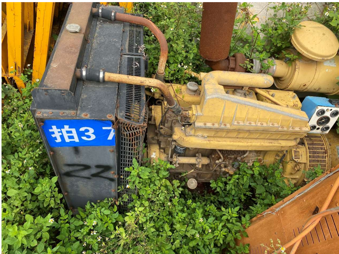
拍卖标的号为：17#（图片：拍37#） 存放地点：南宁市二塘基地