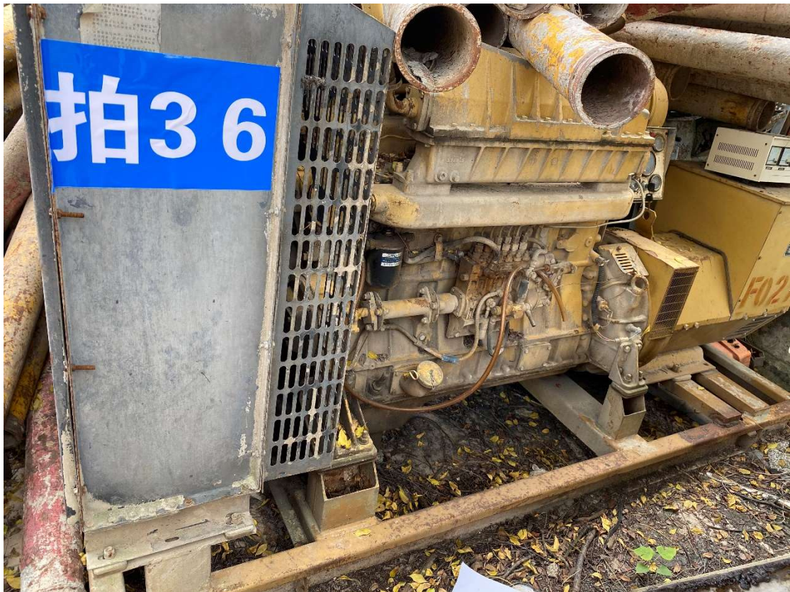
拍卖标的号为：16#（图片：拍36#） 存放地点：南宁市二塘基地