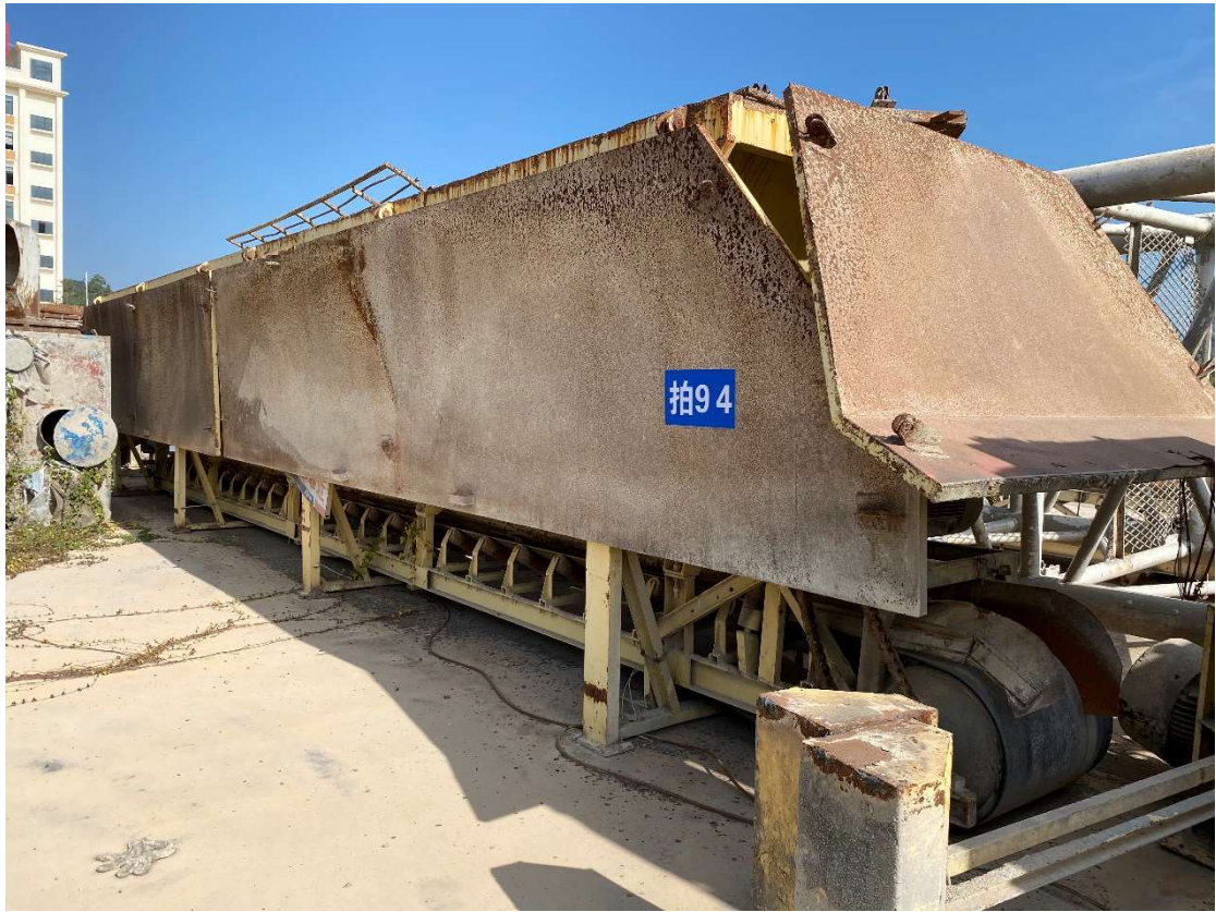
拍卖标的号为：13#（图片：拍 94#） 存放地点：扶绥县山圩基地