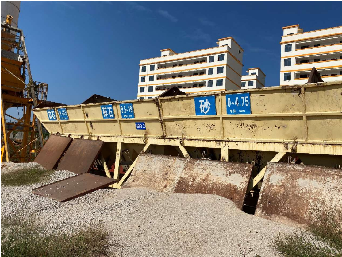
拍卖标的号为：14#（图片：拍 92#） 存放地点：扶绥县山圩基地