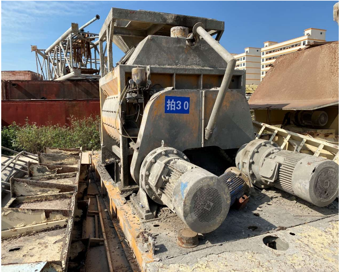
拍卖标的号为：13#（图片：拍 30#） 存放地点：扶绥县山圩基地