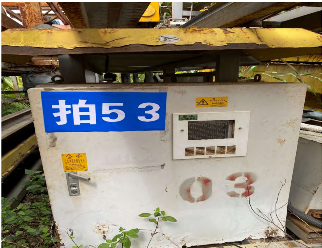
拍卖标的号为：29#（图片：拍53#） 存放地点：南宁市二塘基地