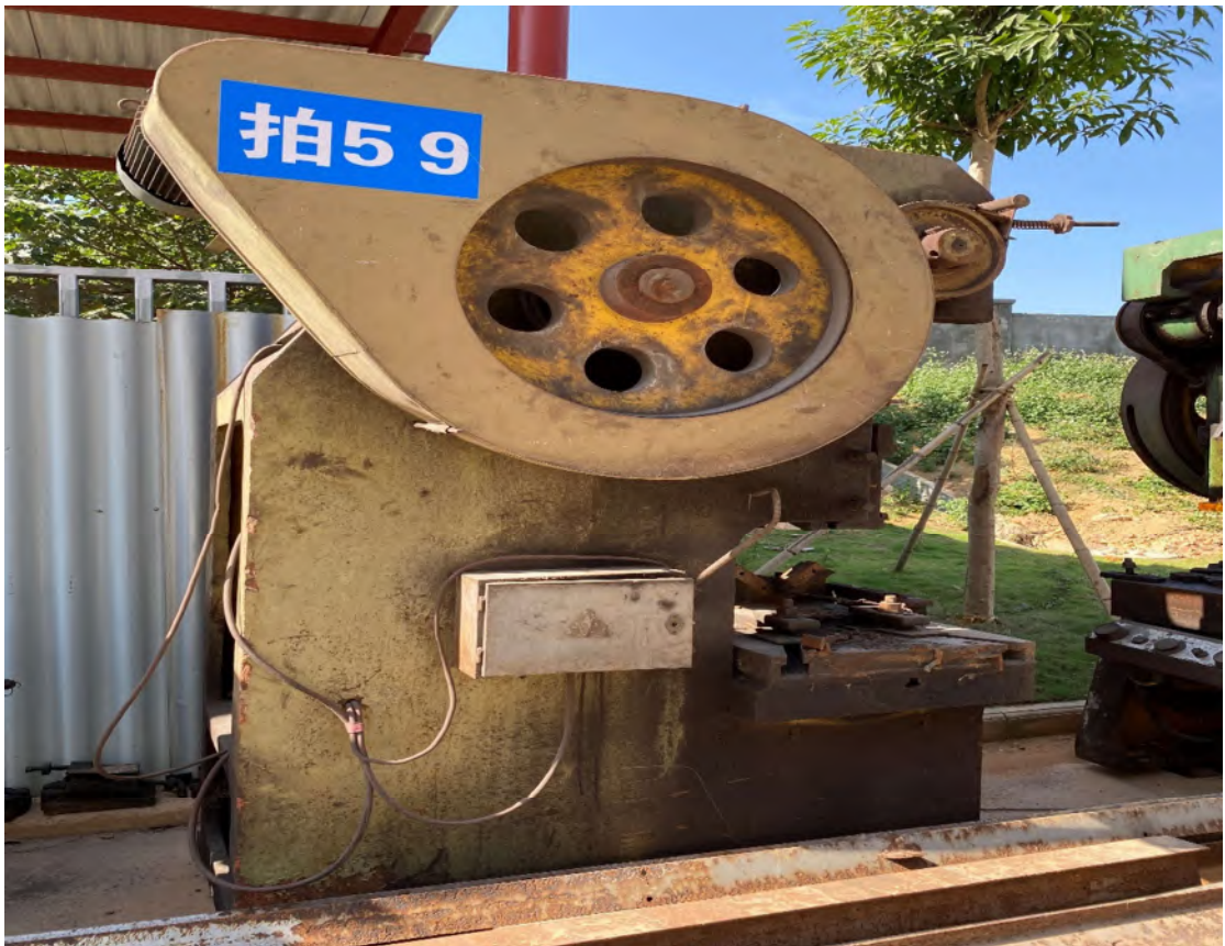
拍卖标的号为：33#（图片：拍 59#） 存放地点：扶绥县山圩基地