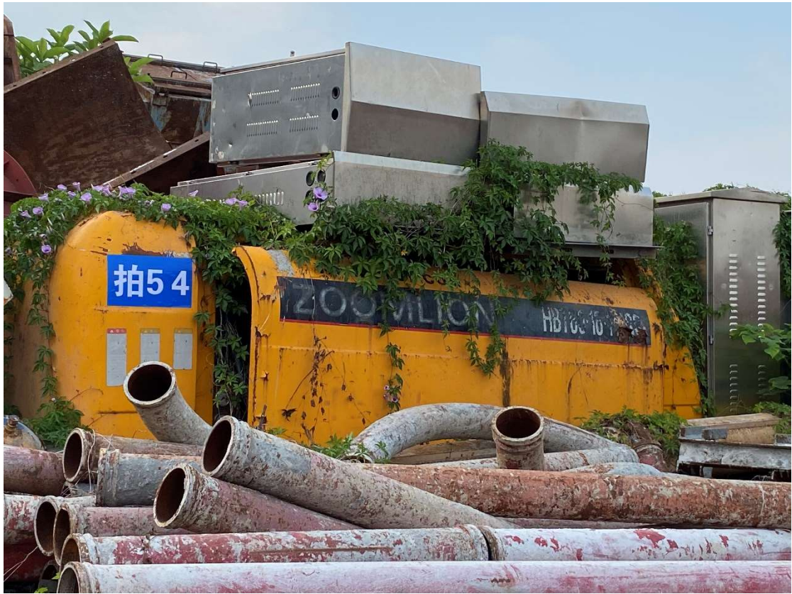
拍卖标的号为：30#（图片：拍 53#） 存放地点：南宁市高峰基地