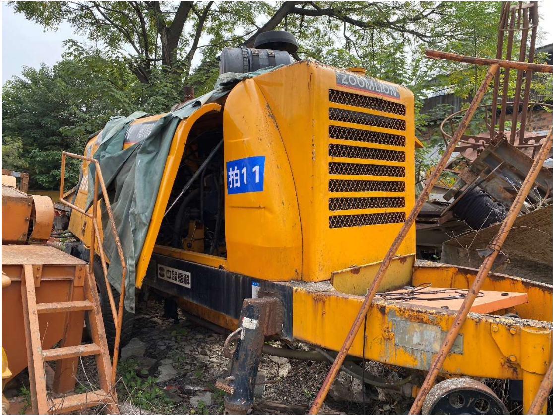
拍卖标的号为：32#（图片：拍 53#） 存放地点：南宁市二塘基地