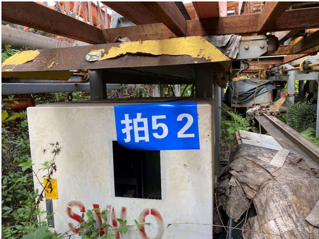
拍卖标的号为：28#（图片：拍52#） 存放地点：南宁市二塘基地