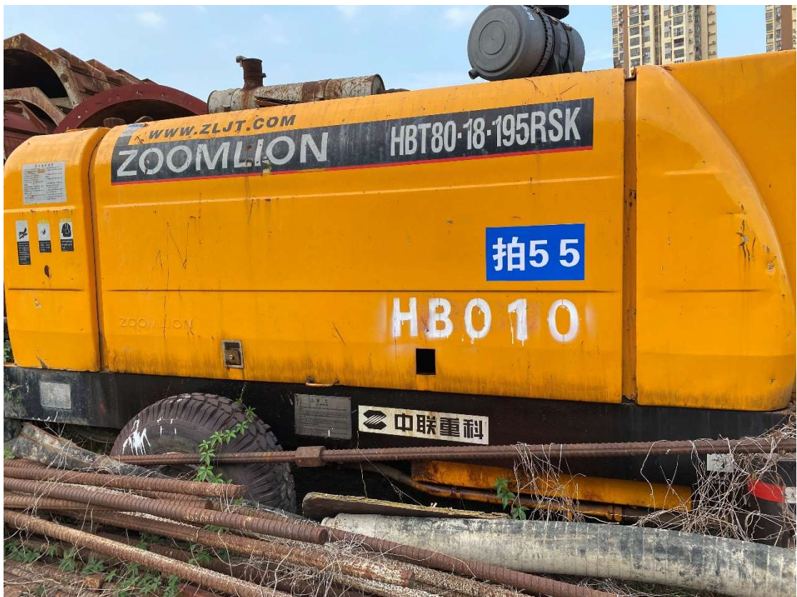
拍卖标的号为：31#（图片：拍 55#） 存放地点：南宁市高峰基地