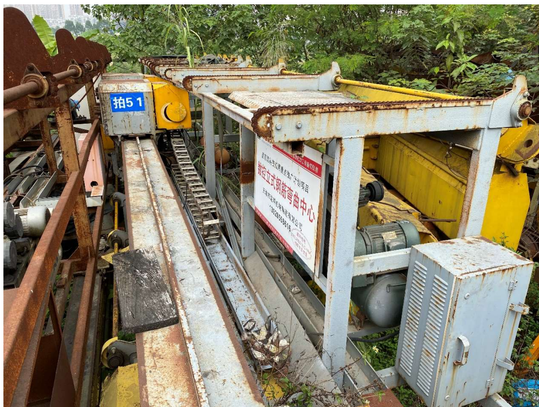
拍卖标的号为：27#（图片：拍 51#） 存放地点：南宁市二塘基地