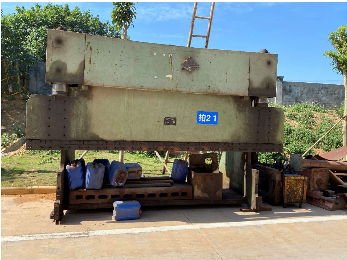
拍卖标的号为：35#（图片：拍21#） 存放地点：扶绥县山圩基地