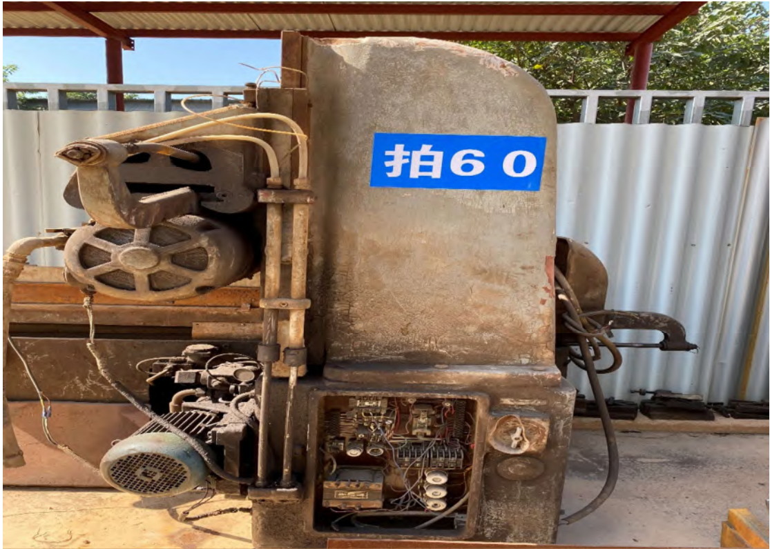
拍卖标的号为：34#（图片：拍60#） 存放地点：扶绥县山圩基地