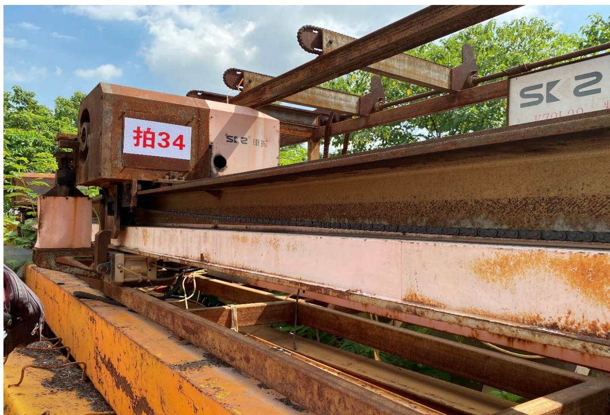
拍卖标的号：5# 设备类型：数控钢筋弯曲中心 自编号：SWQ006 存放地点：二塘