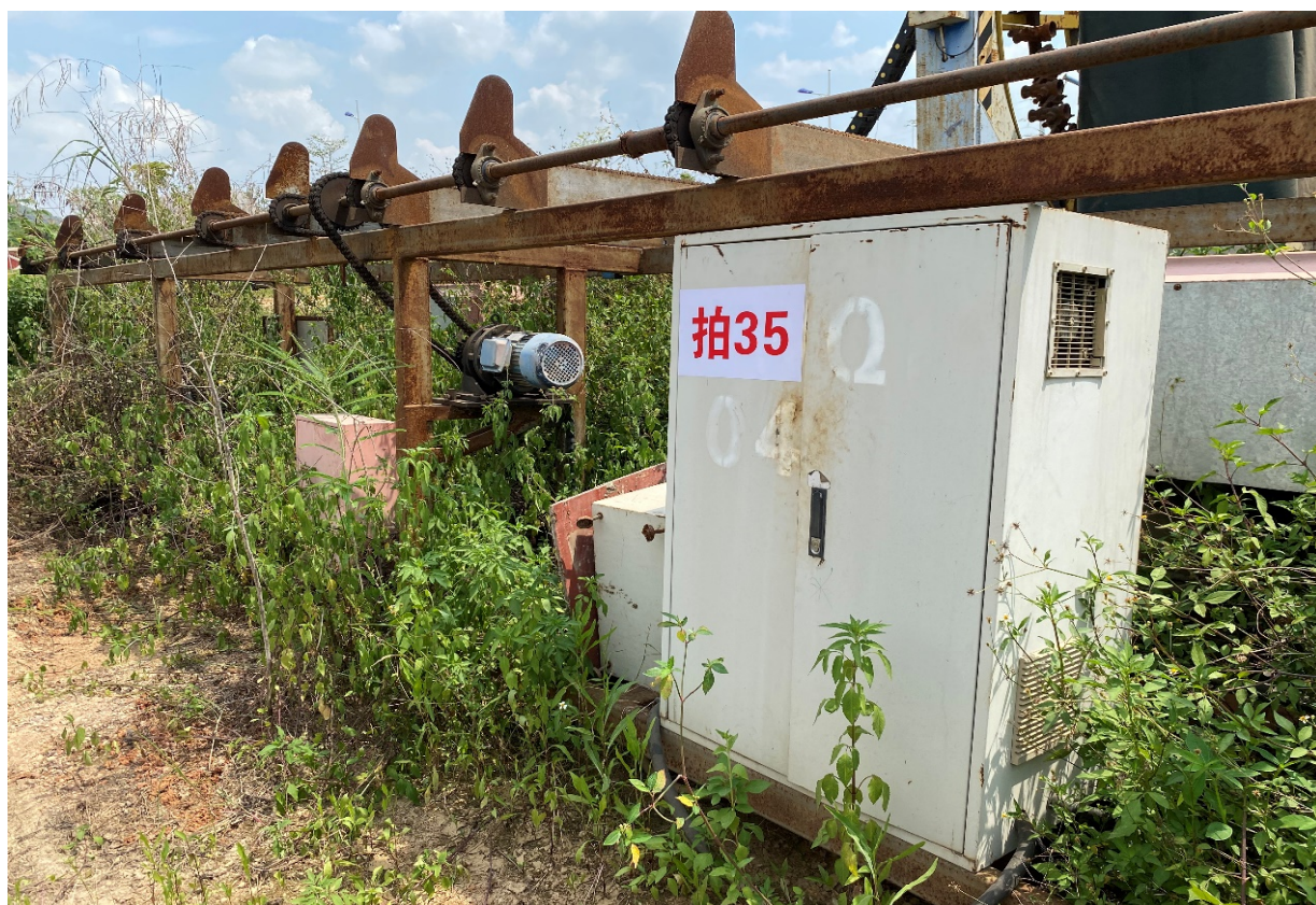
拍卖标的号：5# 设备类型：数控钢筋弯曲中心 自编号：SWQ009 存放地点：山圩