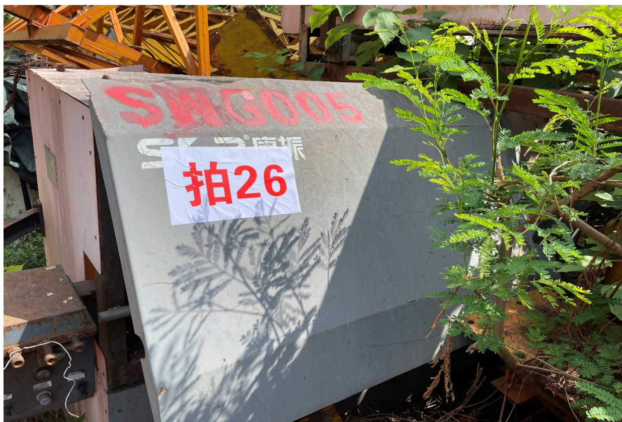
拍卖标的号：5# 设备类型：数控钢筋弯箍机 自编号：SWG005 存放地点：二塘